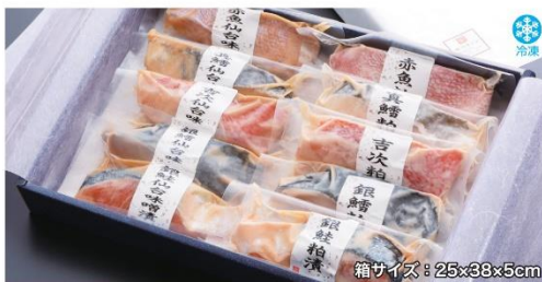
商品番号 KNG-002 箱サイズ: 25×38×5cm

おととの仙台味噌漬・粕漬A.....¥3,500 赤魚仙台味噌漬・粕漬/真鱈仙台味噌漬・粕漬/銀鱈仙台味噌漬・粕漬/銀鮭仙台味噌漬・粕漬(各80g×1切、計8切入) 賞味期限: 冷凍60日、解凍後4日