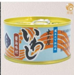
商品番号 KS-009 国産 いわし醤油味付け 内容量：170g ……………1缶 ¥380