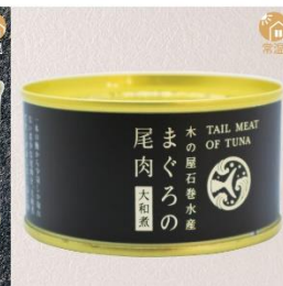
商品番号 KS-019 国産 まぐろの尾肉大和煮 内容量：170g ……………1缶 ¥500