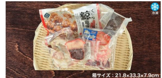
商品番号 KSG-006 箱サイズ：21.8×33.3×7.9cm 冷凍くじら食べくらべセットA .....特別価格¥5,373 ミンク鯨敵須ペーコンブロック(90g×1パック)・鯨ペーコン切り落とし(40g×1パック) 刺身用ミンク鯨赤肉(200g×1パック)・鯨竜田揚げ(150g×1パック)・鯨さえずりペーコン(40g×1パック)