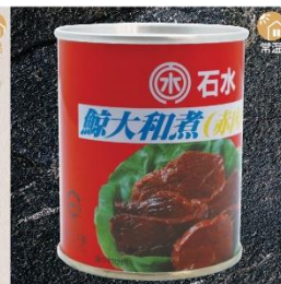
商品番号 KS-013 国産 鯨大和煮(7号缶) 内容量：235g ……………1缶 ¥600