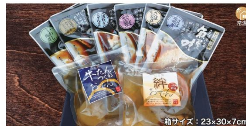
商品番号 YHG-002 おでん魚惣菜セット.....¥2,900 さば味噌煮、さば生姜煮、さんま生姜煮、いわし梅煮、浅炊きさんま、浅炊きさんま・たらこ・昆布、絆おでん、牛たんつくねおでん