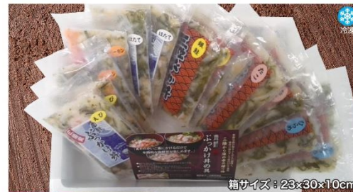
商品番号 HFG-002 三陸ぶっかけ丼の具12袋セット...¥4,900 えび・サーモン・ほたて・銀鮭・たこ・ひらめ(各100g×2袋)