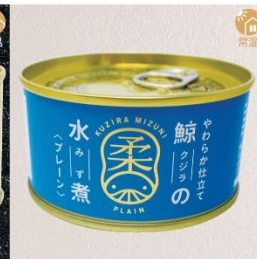
商品番号 KS-011 国産 鯨の水煮 内容量：150g ……………1缶 ¥410