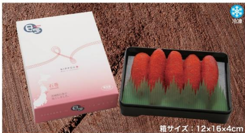
商品番号 NBG-005 ご贈答用明太子.....¥1,200 (200g)