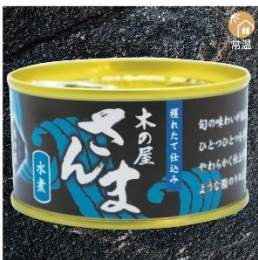
商品番号 KS-008 国産 さんま水煮 内容量：170g ……………1缶 ¥380