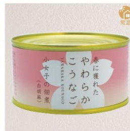
商品番号 KS-016 国産 小女子佃煮 白胡麻 内容量：90g ……………1缶 ¥430