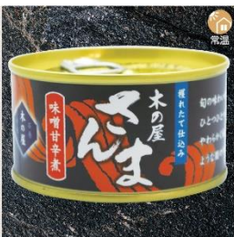
商品番号 KS-007 国産 さんま味噌甘辛煮 内容量：170g ……………1缶 ¥380