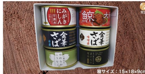
商品番号 KSG-005 箱サイズ：15×18×9cm 木の屋 彩り6種盛り .....¥3,210 金華さば味噌煮(170g)・金華さば水煮(170g)・鯨大和煮(170g) 小女子佃煮(3種のうち1種90g)・まぐろの尾肉大和煮(170g)・みがきにしん甘露煮(170g)