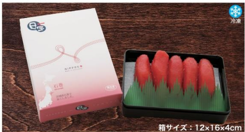
商品番号 NBG-004 ご贈答用たらこ.....¥1,200 (200g)