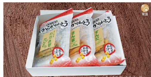
商品番号 KRG-001 箱サイズ: 27.7×19.2×7cm

おからかりんとう3個セット(化粧箱).....¥1,350 わかめ・さんま・ずんだ