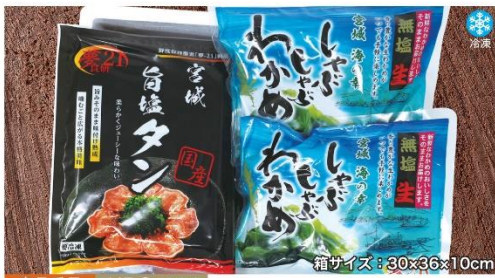
商品番号 KRG-004 箱サイズ: 30×36×10cm

うまいもんセット.....¥3,700 しゃぶしゃぶわかめ(1袋)・旨塩たん(2袋)・かれいの煮付(1袋)・生ほや、蒸しほや(各1袋)