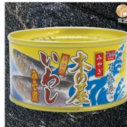
商品番号 KS-010 国産 いわし味噌煮 内容量：170g ……………1缶 ¥380