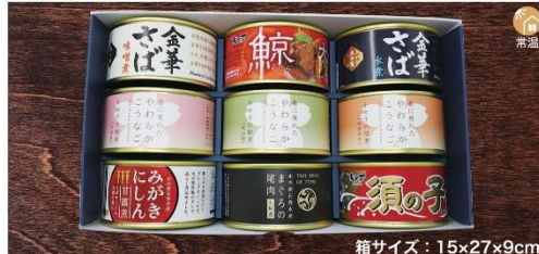
商品番号 KSG-002 箱サイズ：15×27×9cm 木の屋 彩り9種盛り .....¥4,970 金華さば味噌煮(170g)・金華さば水煮(170g)・鯨大和煮(170g) 鯨須の子(大和煮170g)・小女子佃煮(白胡麻入90g)・小女子佃煮(一味唐辛子入90g) 小女子佃煮(栗山椒90g)・まぐろの尾肉大和煮(170g)・みがきにしん甘露煮(170g)