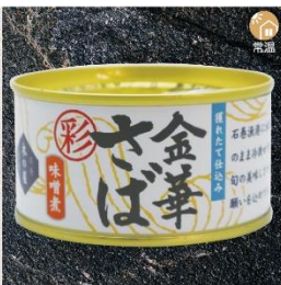
商品番号 KS-003 国産 金華さば味噌煮(彩) 内容量：170g ……………1缶 ¥470