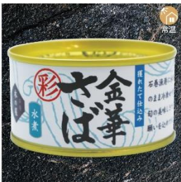
商品番号 KS-004 国産 金華さば水煮(彩) 内容量：170g ……………1缶 ¥470