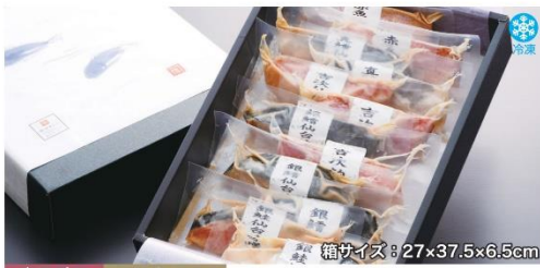
商品番号 KNG-003 箱サイズ: 27×37.5×6.5cm

おととの仙台味噌漬・粕漬C.....¥5,300 赤魚仙台味噌漬・粕漬/真鱈仙台味噌漬・粕漬/銀鱈仙台味噌漬・粕漬/銀鮭仙台味噌漬・粕漬/吉次仙台味噌漬・粕漬(銀鱈仙台味噌漬・吉次粕漬各80g×2切、他80g×1切、計12切入) 賞味期限: 冷凍60日、解凍後4日