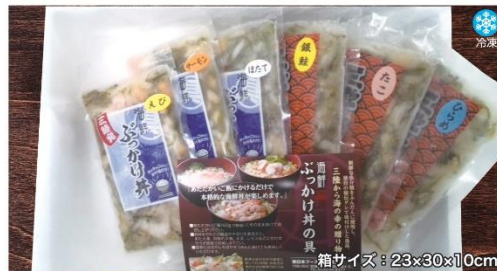
商品番号 HFG-001 三陸ぶっかけ丼の具6袋セット...¥2,850 えび・サーモン・ほたて・銀鮭・たこ・ひらめ(各100g×1袋)