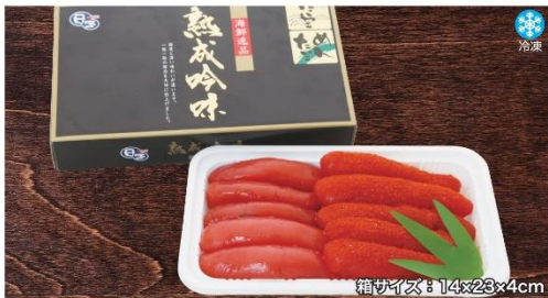
商品番号 NBG-003 ご贈答用たらこ・明太子詰合せ...¥2,700 (各250g)