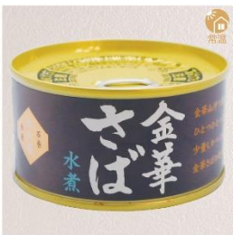
商品番号 KS-002 国産 金華さば水煮 内容量：170g ……………1缶 ¥490