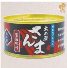
商品番号 KS-006 国産 さんま醤油味付け 内容量：170g ……………1缶 ¥380