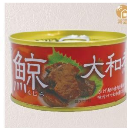
商品番号 KS-012 国産 鯨大和煮 内容量：170g ……………1缶 ¥500