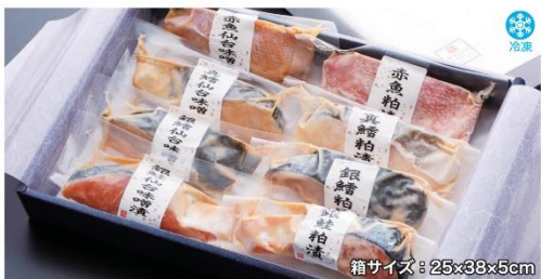
商品番号 KNG-001 箱サイズ: 25×38×5cm

おととの仙台味噌漬・粕漬A.....¥3,500 赤魚仙台味噌漬・粕漬/真鱈仙台味噌漬・粕漬/銀鱈仙台味噌漬・粕漬/銀鮭仙台味噌漬・粕漬(各80g×1切、計8切入) 賞味期限: 冷凍60日、解凍後4日