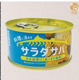
商品番号 KS-005 国産 サラダさば(あっさり塩味) 内容量：170g ……………1缶 ¥380