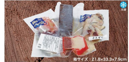
商品番号 KSG-007 箱サイズ：21.8×33.3×7.9cm 冷凍くじら食べくらべセットB .....¥4,900 刺身用ミンク鯨赤肉(200g×1パック)・ミンク鯨敵須ペーコンブロック(90g×1パック) 鯨ペーコン切り落とし(40g×1パック)・鯨さえずり切り落とし(80g×1パック)