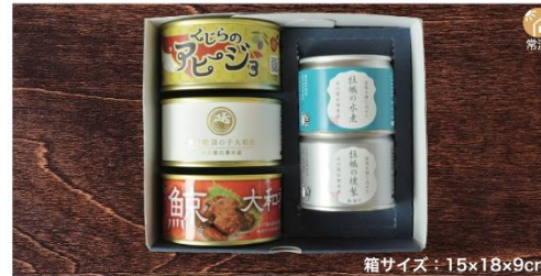
商品番号 KSG-003 箱サイズ：15×18×9cm くじら&牡蠣セット .....特別価格¥4,023 牡蠣の水煮(125g)・牡蠣の薫製(115g)・くじらのアヒージョ(150g) 長須鯨須の子 大和煮(150g)・鯨大和煮(170g)