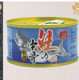
商品番号 KS-015 国産 鮭の中骨水煮 内容量：180g ……………1缶 ¥280