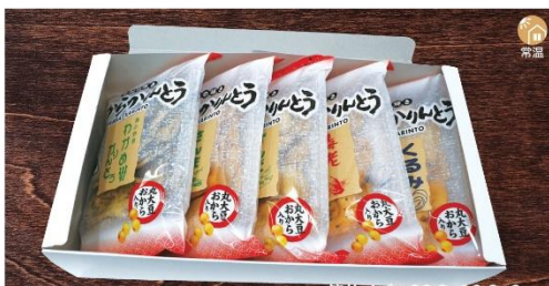
商品番号 KRG-002 箱サイズ: 36.3×19.3×9cm

おからかりんとう3個セット(化粧箱).....¥1,350 わかめ・さんま・ずんだ