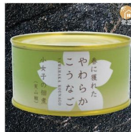
商品番号 KS-018 国産 小女子佃煮 実山椒 内容量：90g ……………1缶 ¥430