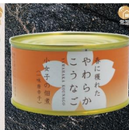
商品番号 KS-017 国産 小女子佃煮 一味唐辛子 内容量：90g ……………1缶 ¥430