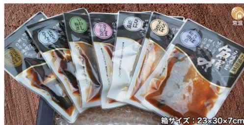
商品番号 YHG-001 魚惣菜セット.....¥2,500 さば味噌煮、さば生姜煮、さば塩焼き、さんま生姜煮、いわし梅煮、浅炊きさんま、浅炊きさんま・たらこ・昆布