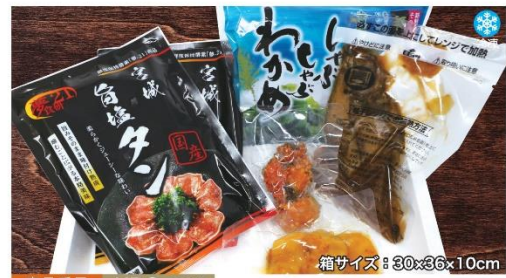
商品番号 KRG-003 箱サイズ: 30×36×10cm

おからかりんとう5個セット(化粧箱).....¥1,900 わかめ・さんま・ずんだ・えび・くるみ