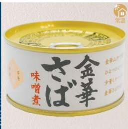
商品番号 KS-001 国産 金華さば味噌煮 内容量：170g ……………1缶 ¥490