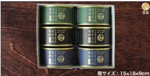
商品番号 KSG-001 箱サイズ：15×18×9cm まぐろ食べくらべ3種盛り .....特別価格¥3,555 まぐろの尾肉油揚げ(135g×2缶)・まぐろの尾肉大和煮(170g×2缶) まぐろの尾肉水煮(165g×2缶)