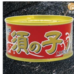
商品番号 KS-014 国産 鯨須の子(大和煮) 内容量：170g ……………1缶 ¥800